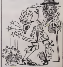
L'actualité de la BD et pépé Gollib sont en page 12

DES PROGRAMMES POUR VOTRE ORDINATEUR AMSTRAD . APPLE IIe et IIc . CANON X-07 . CASIO FX 702-P . COMMODORE 64 ET VIC 20 . EXELVISION EXL 100 . HECTOR HR . MSX et compatibles . ORIC 1 ET ATMOS . SINCLAR ZX 81 ET SPECTRUM . TEXAS TI-99/4A . THOMSON TO7, TO7/70, ET MO5.